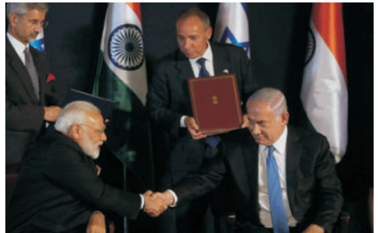
മോദിയും നെതന്യാഹുവും സംയുക്ത പ്രസ്താവനയിൽ ആവശ്യപ്പെട്ടു.

കരാറുകളിൽ ഇരു രാജ്യങ്ങളും ഒപ്പിട്ടു. ബഹിരാകാശം, കൃഷി, ജലസംരക്ഷണം, ഗവേഷണം തുടങ്ങിയ മേഖലകളിലാണ് കരാർ. കൃഷിയിൽ മൂന്നു വർഷത്തെ ഇന്ത്യ-ഇസ്രയേൽ ഡെവലപ്മെന്റ് കോ-ഓപ്പറേഷൻ ഉടമ്പടിയാണ് പ്രധാനം. ജലസംരക്ഷണത്തിന് ഒരു കരാറും ഇന്ത്യയിലെ ജലവിതരണ സംവിധാനം നവീകരിക്കാനുള്ള വേറൊരു കരാറും ഉണ്ട്. നാലു കോടി ഡോളറിന്റെ (260 കോടി രൂപ) ഒരു സാങ്കേതിക വിദ്യ വികസനനിധിക്കും കരാർ ഒപ്പിട്ടും പലസ്തീൻ പ്രശ്നത്തിന് എത്രയും വേഗം ചർച്ചകളിലൂടെ പരിഹാരം കണ്ടെത്തണമെന്ന്